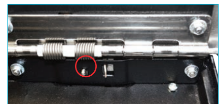
La pestaña de rápida liberación permite extraer fácilmente La unidad SMARTtill de la placa base