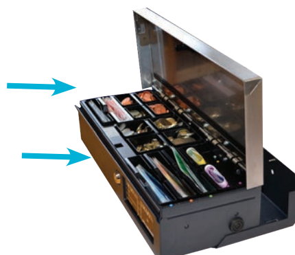
Modelo SMARTtill (Versión 7 billeteros) Muestra con la placa base