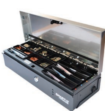
Modelo SMARTtill (Versión 5 billeteros)